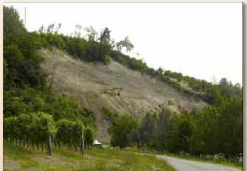
"Prima trance" lavori di risistemazione frana via Moglia Gerlotto