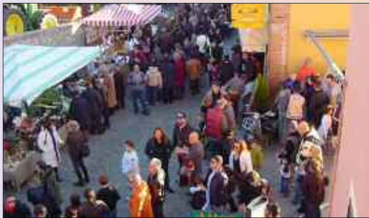
Un momento della Fëra 'D Dian