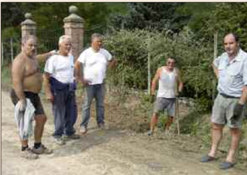
Volontari al lavoro in via Santa Croce, località Camparo