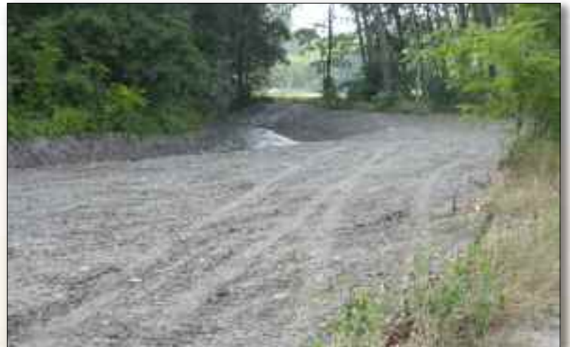
Pulizia torrenti del capoluogo