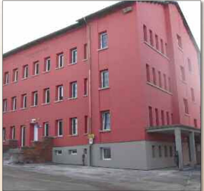
Lavori di riqualificazione energetica dell'edificio scolastico del capoluogo